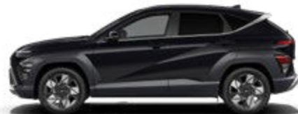
Abyss Black Pearl nicht verfügbar für Hybrid