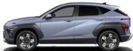
Meta Blue Pearl nicht verfügbar für N Line