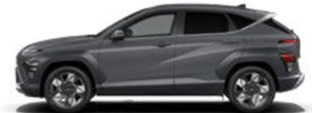
Ecotronic Gray Pearl