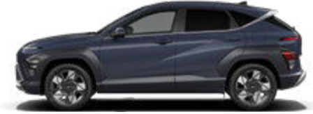
Denim Blue Pearl