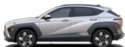
Shimmering Silver Metallic nicht verfügbar für Hybrid