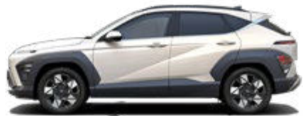
Serenity White Pearl nicht verfügbar für Hybrid