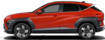
Soultronic Orange Pearl nicht verfügbar für Benzin und N Line