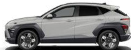
Cyber Gray Metallic