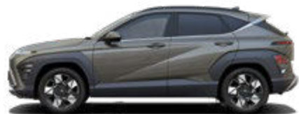
Amazon Gray Metallic (nicht verfügbar für Hybrid und N Line)