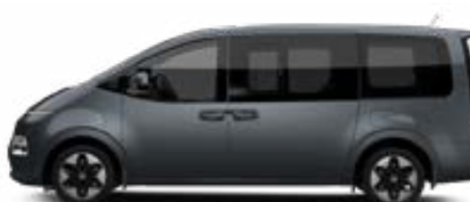
Graphite Gray Metallic