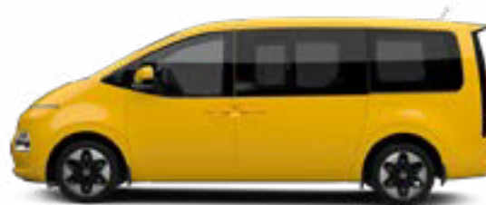
Dynamic Yellow nur für Transporter verfügbar