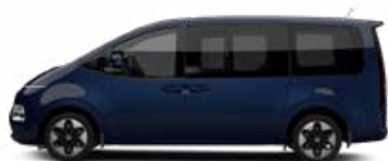
Moonlight Blue Pearl