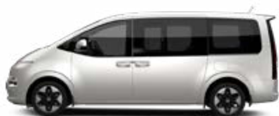
Shimmering Silver Metallic