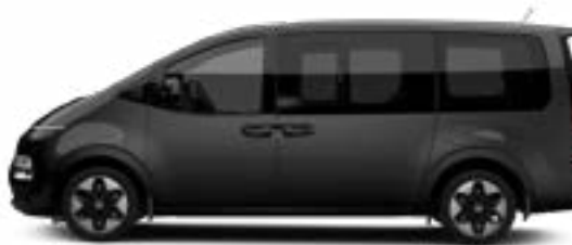
Abyss Black Pearl