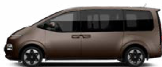
Gaia Brown Pearl nur für Bus verfügbar