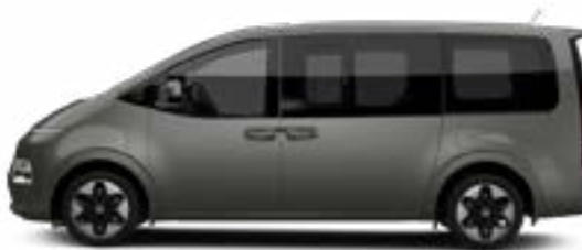
Olivine Gray Metallic nur für Bus verfügbar